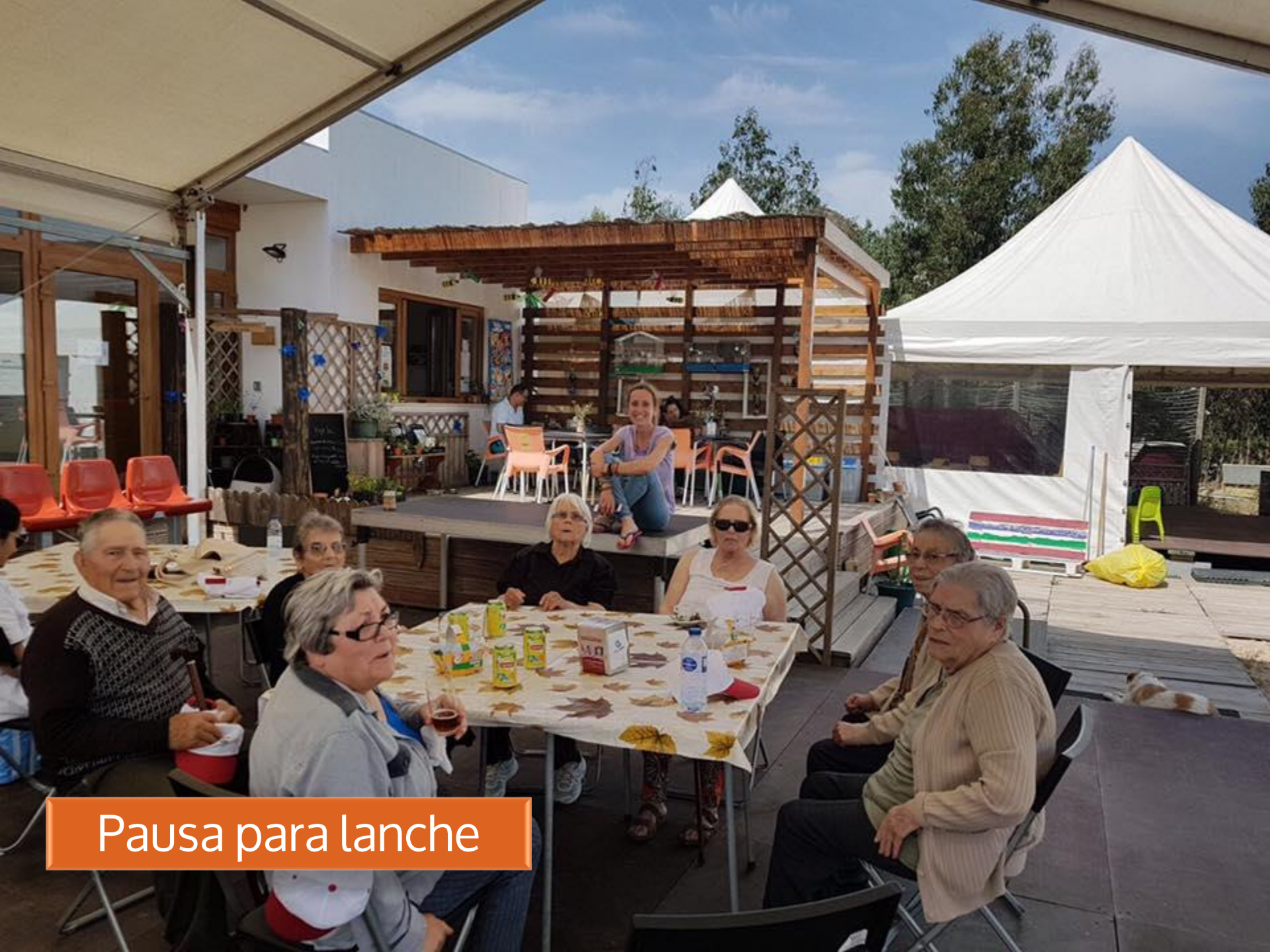
Pausa para lanche