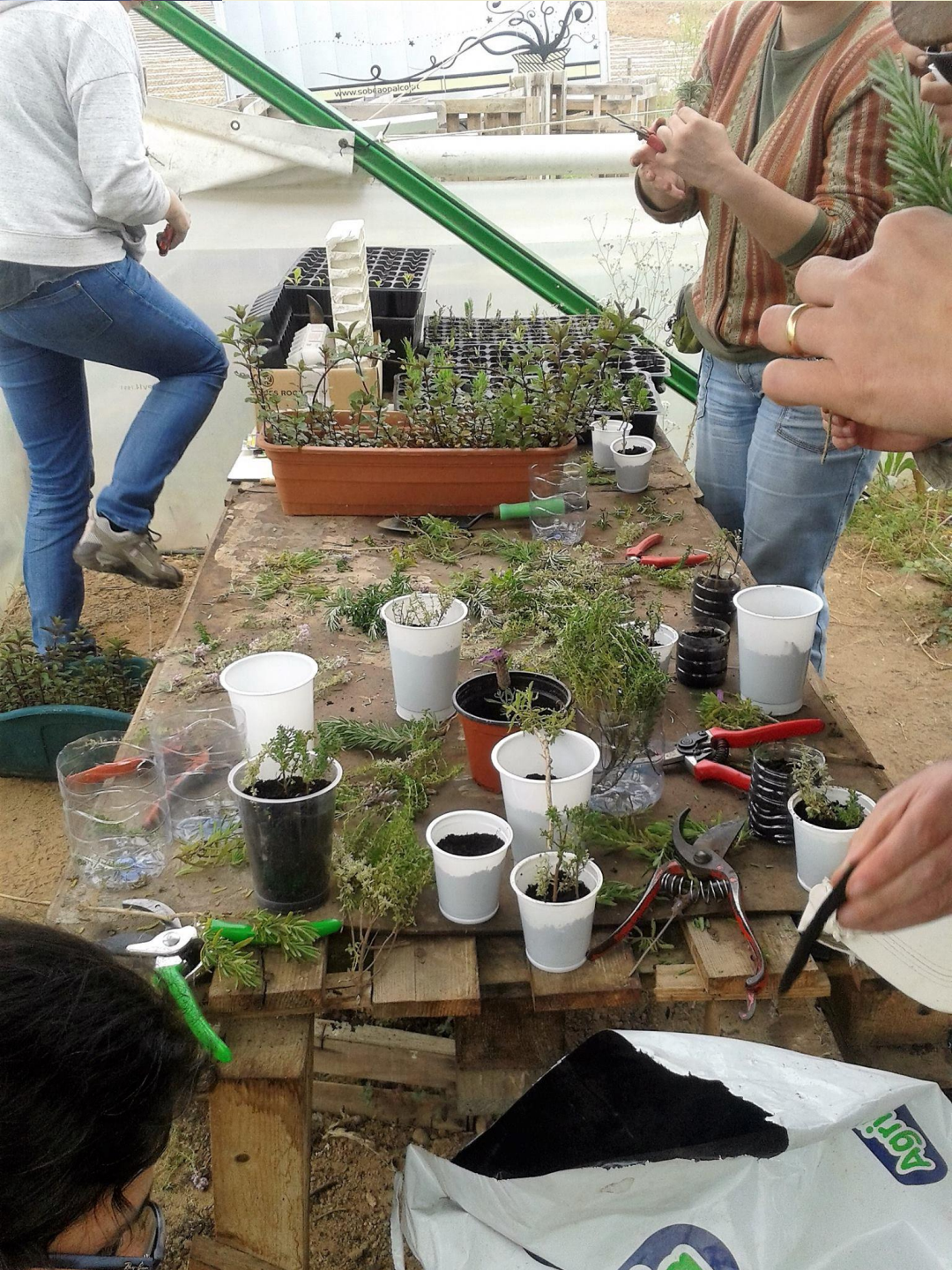
Atelier de estacaria