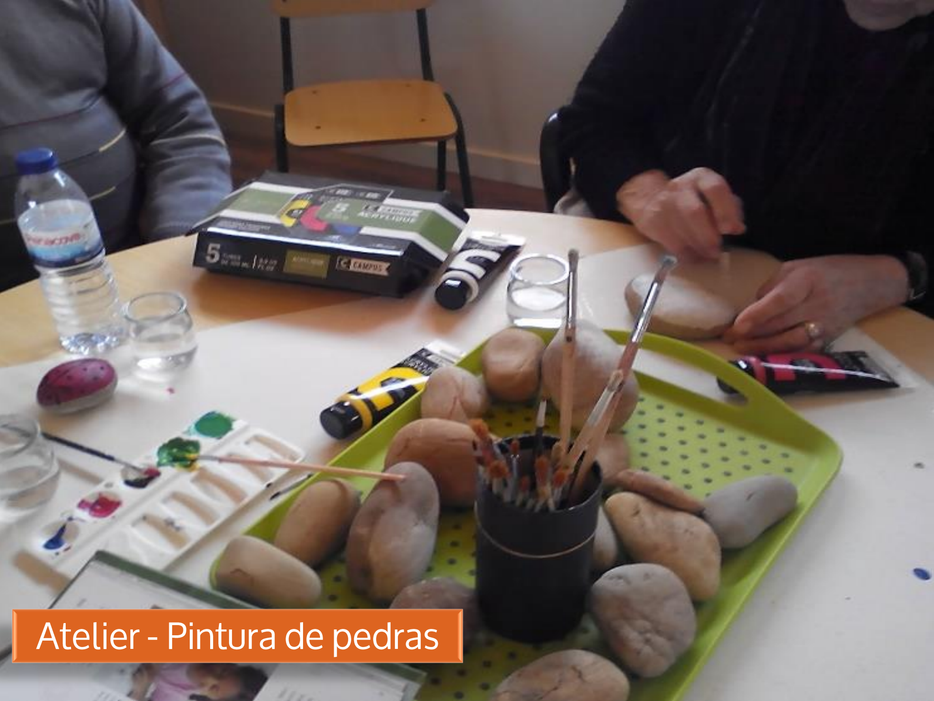
Atelier - Pintura de pedras