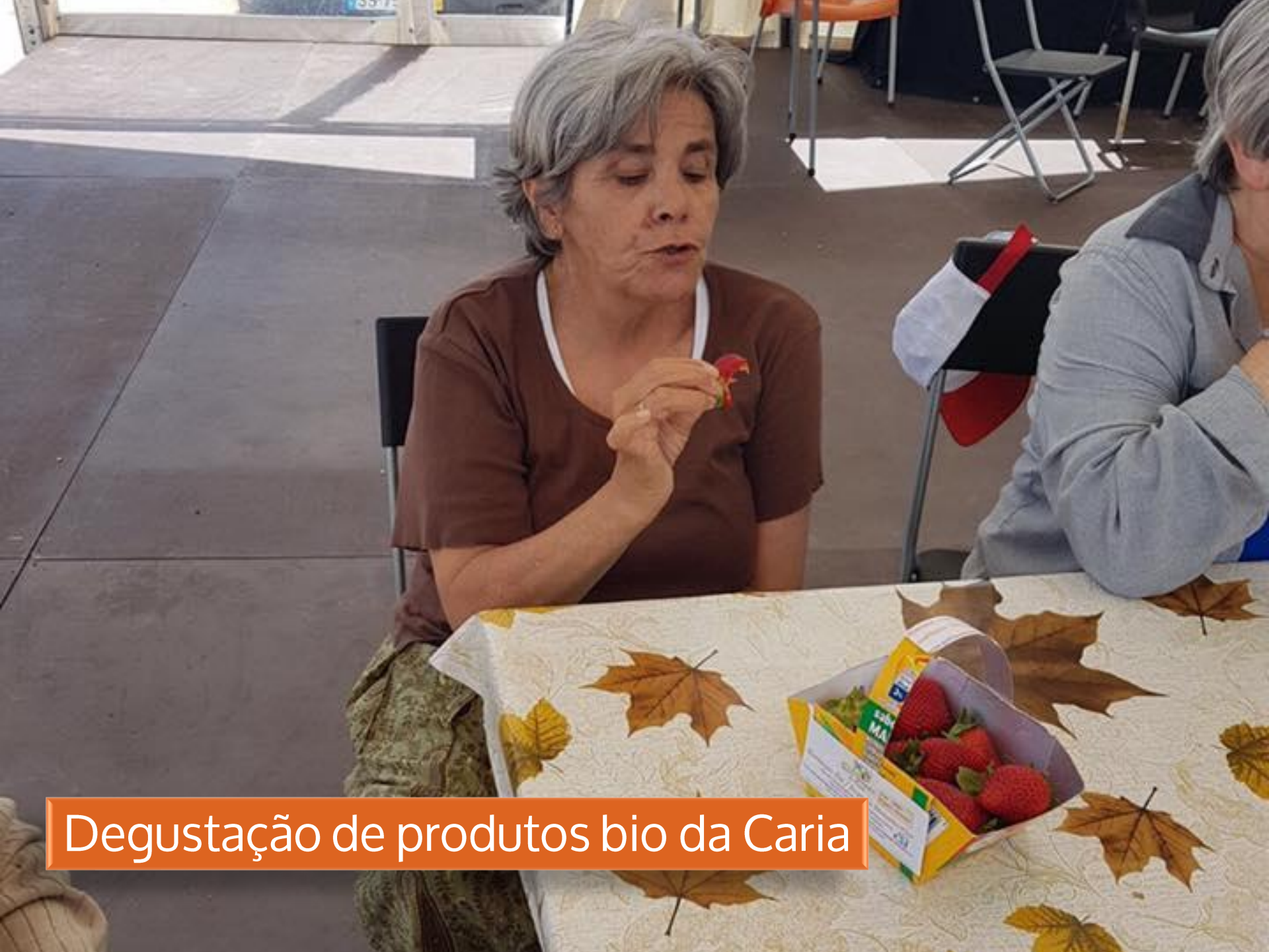
Degustação de produtos bio da Caria