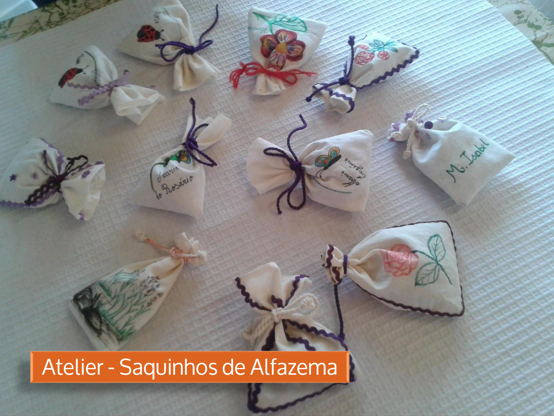
Atelier - Saquinhos de Alfazema